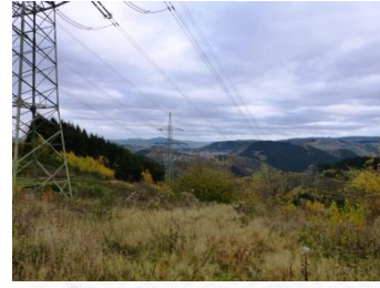
3 Blick auf Pungelscheid