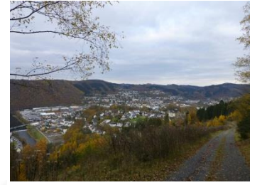
4 Blick auf Werdohl