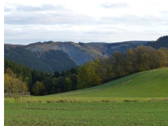
7 Steinbruch (Plettenberg)