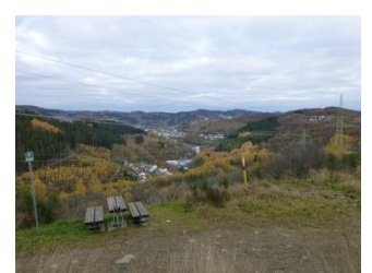
5 Blick auf Königsburg